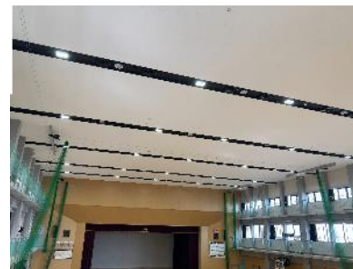
（高浜小学校体育館）