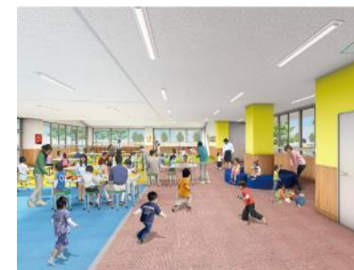
（高浜児童センター）