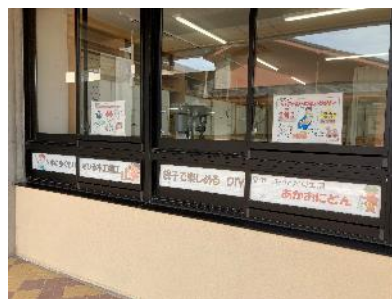
（公民館機能： ものづくり工房室） ※市民利用が可能